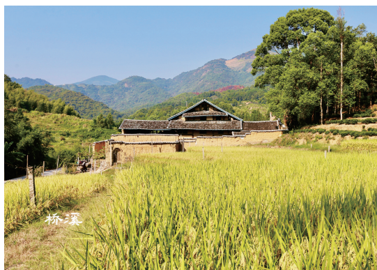
穆云畲族乡桥溪村