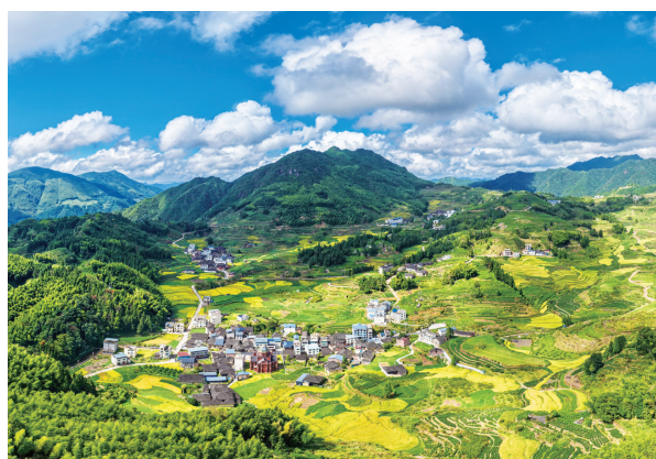
穆云畲族乡外洋村