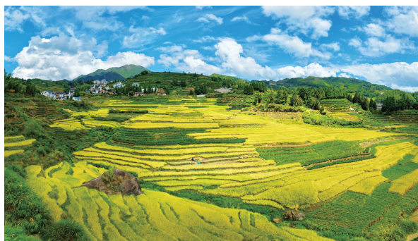
穆云畲族乡上村村