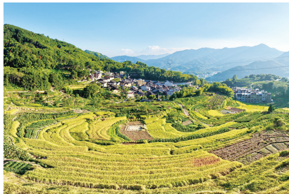
康厝畲族乡金斗洋村